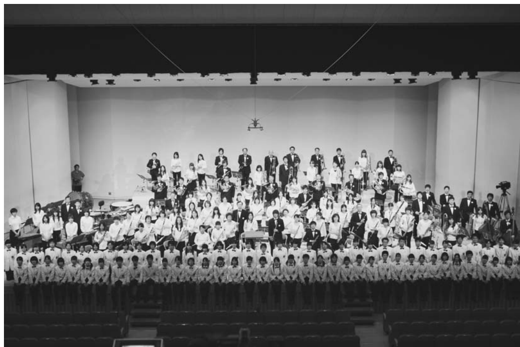
2011年8月14日に行われた特別演奏会の様子